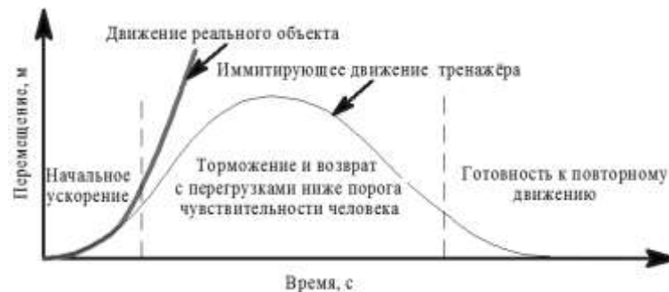
Рисунок 1 - Имитация кратковременно действующей перегрузки или углового ускорения

Динамика движения динамической платформы для имитации кратковременно действующей перегрузки или углового ускорения продемонстрирована на рисунке 1.